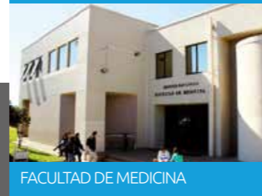
FACULTAD DE MEDICINA

Universidad Católica de la Santísima Concepción