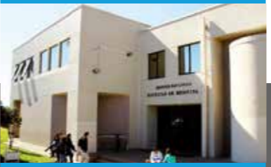
FACULTAD DE MEDICINA

Universidad Católica de la Santísima Concepción