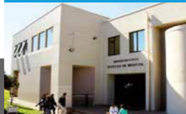
FACULTAD DE MEDICINA

Universidad Católica de la Santísima Concepción